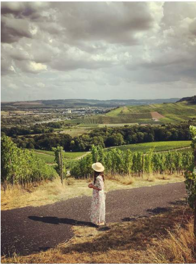
@minorandli ☁️ 🍷 🌿 #vineyard #remich #luxembourg