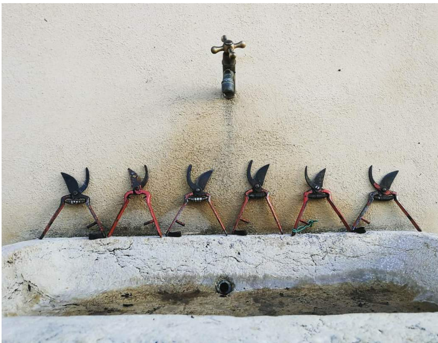
@vinyesdelterrer Bon dia. #vinyesdelterrer