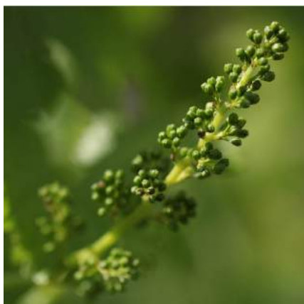
@Chateauxdesannereaux Grappe visible séparée / Bunche separated