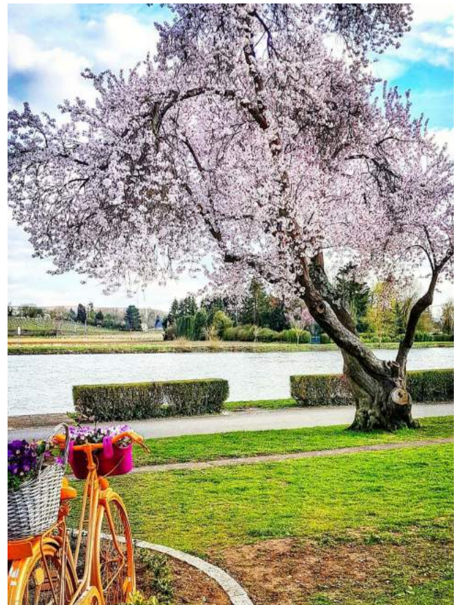
@lussemburghina Spring colors 🌸 🌸 🌸