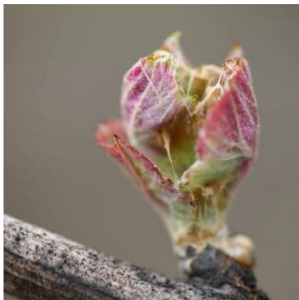
@Chateaudesannereaux Sortie des feuilles / Leaves appear