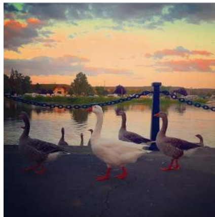
@amaiajau27 ☁️ 🍷 🌿 #vineyard #remich #luxembourg