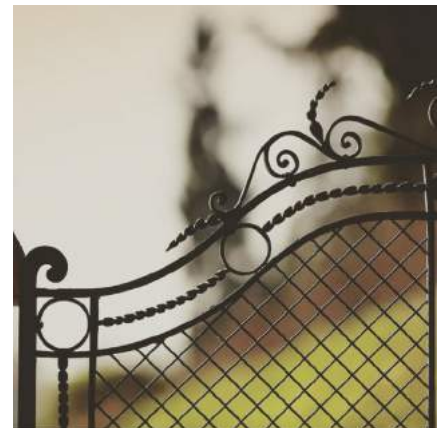
@cavesgales #CavesGales #Gales #Vins #Crémants #Luxembourg #followus