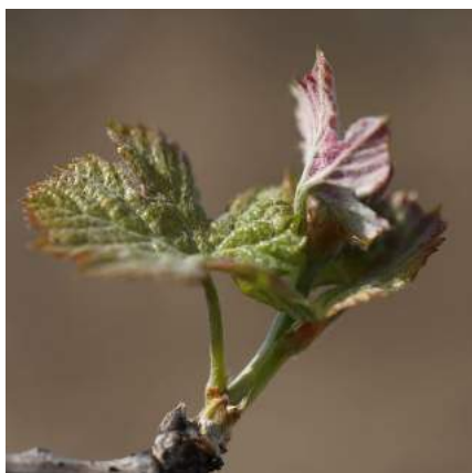
@Chateaudesannereaux Feuilles étalées / Leaves unfold