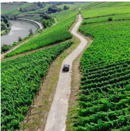
@k.kopytki 🎬 🚗 •Every drone day is a good day• 🎬 🚗