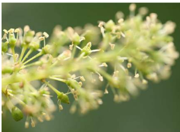
@Chateaudesannereaux Floraison / Flowering